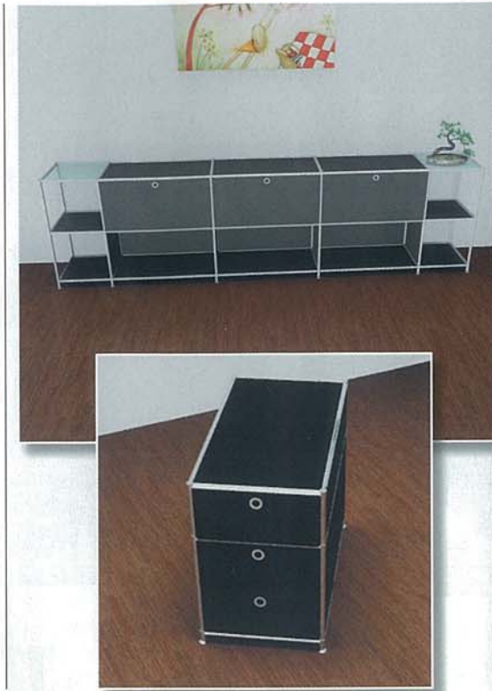
SYSTEM 4: Aus verchromten Stahlprofilen in zwei Längen und verschiedenen Modulteilen entstehen zahlreiche Kombinationsmöglichkeiten.

Passend zu dem zeitlos-eleganten Möbelprogramm hat viasit mit dem „pure“ einen Dreh- und Konferenzstuhl im Portfolio. Seine Merkmale: Klare Linien, hochwertige Materialien und eine Reihe von frei wählbaren Optionen: „pure“ ist wahlweise mit Komfort-Wippmechanik, mit normaler oder erhöhter Rückenlehne, als drehbarer Konferenzsessel oder eben ganz „pur“ erhältlich. Glanzverchromte Armlehnen und das polierte Aluminium-Fußkreuz verleihen dem Sessel einen Look, der an die klassische Moderne erinnert, und überträgt sie auf heutige Sitz- und Gestaltungsbedürfnisse – ganz im Sinne der Gestaltung von system 4. (nh)