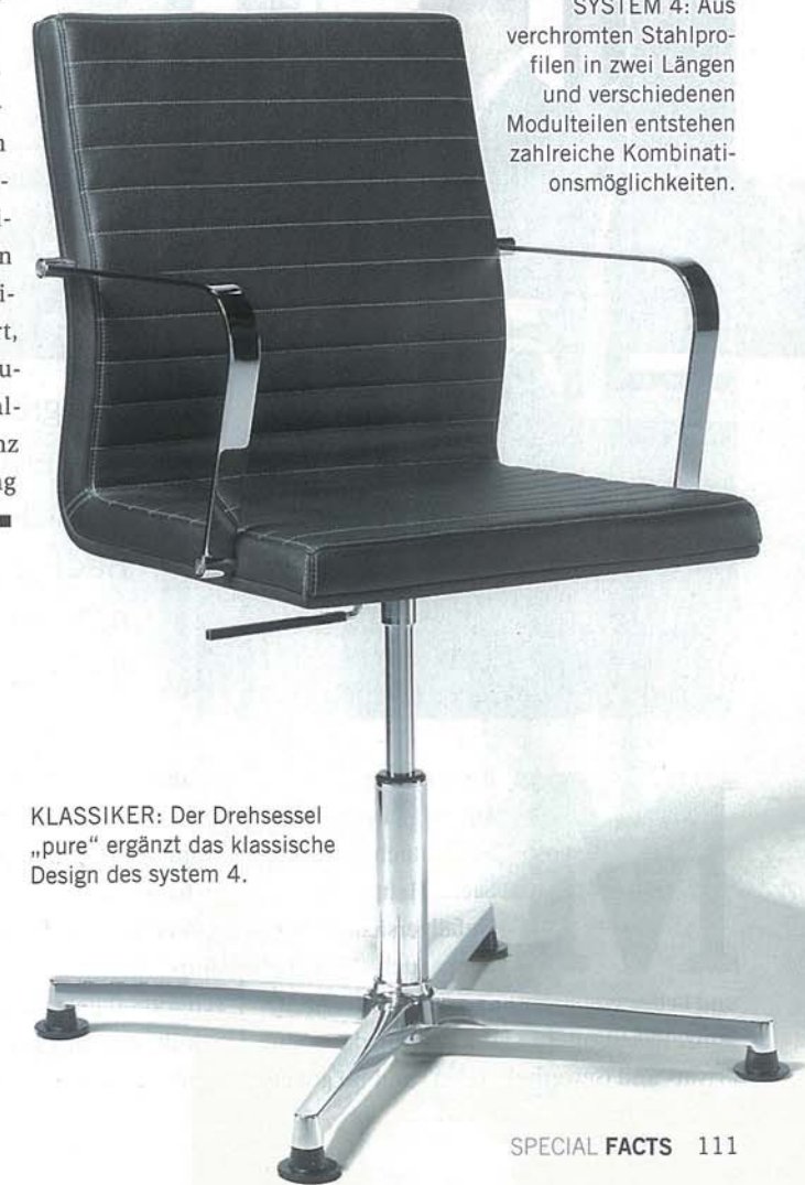
KLASSIKER: Der Drehsessel „pure“ ergänzt das klassische Design des system 4.